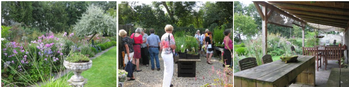
Na koffie/thee in deze schitterende tuin was de omschikking naar de kruidentuin De Groene Hof in Ansen groot.