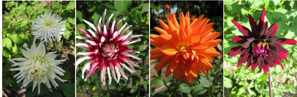
En mooie dahlia's