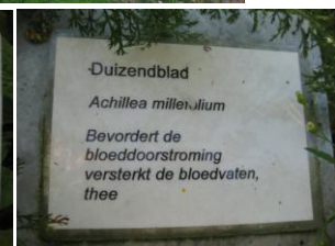
Aanduidingsbordjes bij de kruiden.