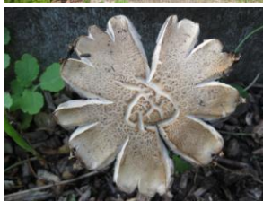
Grappige gespleten paddenstoelhoed.